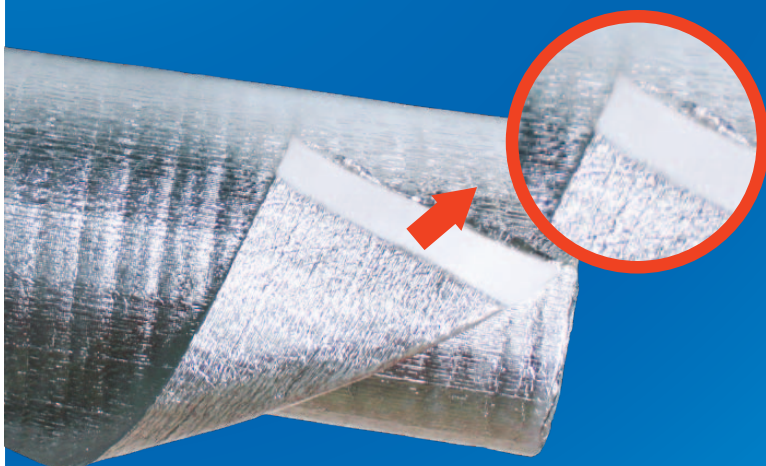
Con grada de 2" con 5 mm de espesor en el borde del rollo de aislante para facilitar y mejorar el traslape entre piezas.

Aislante térmico reflectivo desarrollado bajo las más altas normas de calidad, diseñado para ahorrar energía eliminando el calor radiante que emiten los techos, suelos o paredes dentro de las construcciones. Además, protege su casa, comercio o proyecto brindándole CONFORT en cualquier época del año.